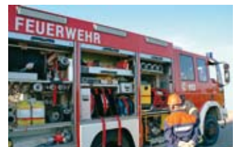
Zumischung und Ausbringen mit gängigen Systemen möglich

Als kompetenter Partner stehen wir Ihnen gerne zur Verfügung.