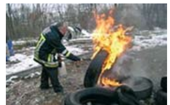
Zum Löschen eines Reifenbrandes werden weniger als 0,5 Liter Prevento® benötigt.